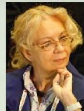
Т.Д. Валовая министр по основным направлениям интеграции и макроэкономики ЕЭК