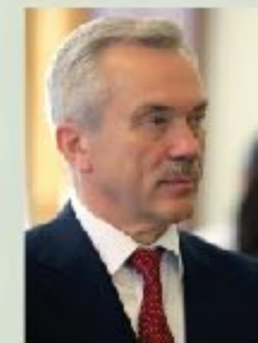
Е.С. Савченко губернатор Белгородской области