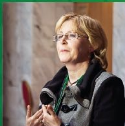
В.И. Скворцова министр здравоохранения РФ