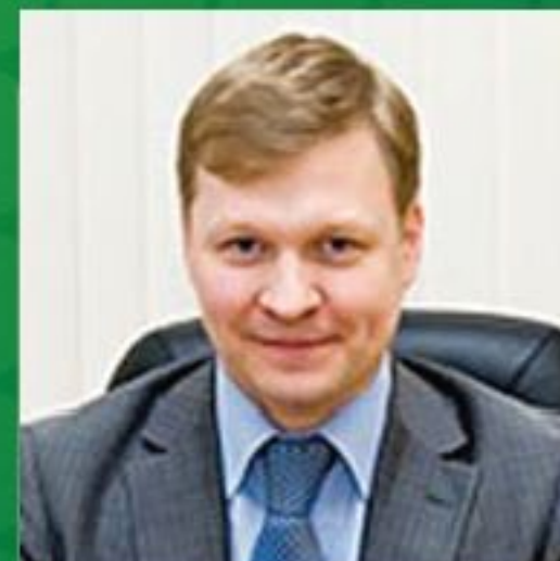
А.Ю. Иванов заместитель министра финансов РФ