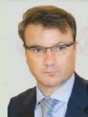
Г.О. Греф президент, председатель правле- ния Сберегательного банка РФ