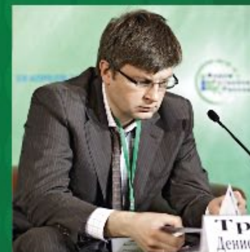
Д.Г. Травин директор Департамента инвестиционных проектов Министерства регионального развития РФ