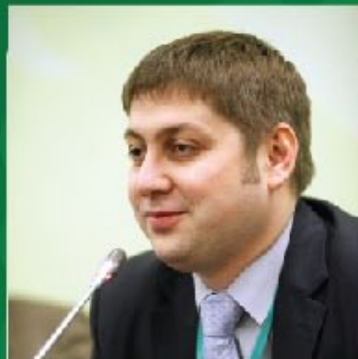
О.В. Фомичев заместитель министра экономического развития РФ