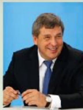
И.Н. Слюняев министр регионального развития РФ