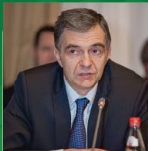
А.В. Юрин заместитель Министра здравоохранения РФ