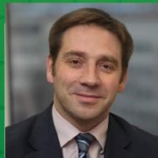
С.Ю. Беляков заместитель министра экономического развития РФ