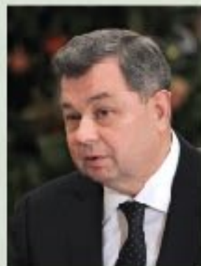
А.Д. Артамонов губернатор Калужской области