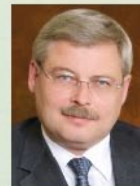
С.А. Жвачкин губернатор Томской области