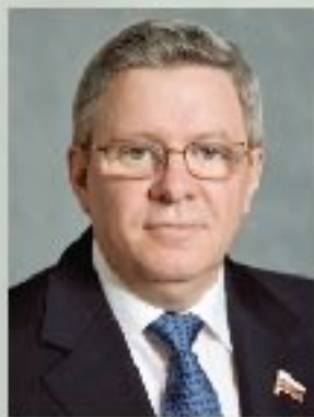
А.П. Торшин Первый заместитель Председателя Совета Федерации РФ

17 апреля 2013 года Москва, МГУ имени М.В. Ломоносова