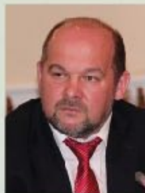
И.А. Орлов губернатор Архан- гельской области