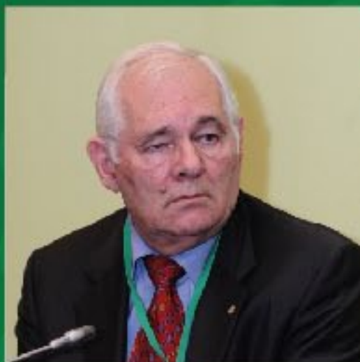
Л.М. Рошаль президент НП «Национальная медицинская палата»