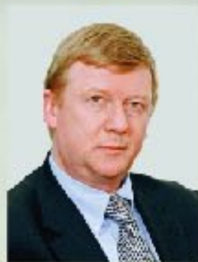
А.Б. Чубайс председатель правления РОСНАНО