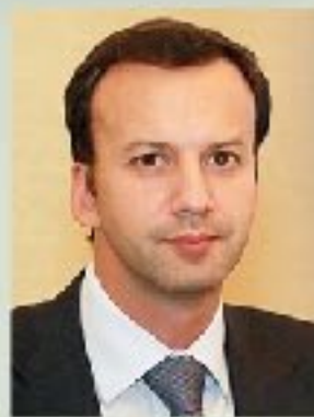
А.В. Дворкович заместитель председа- теля Правительства РФ