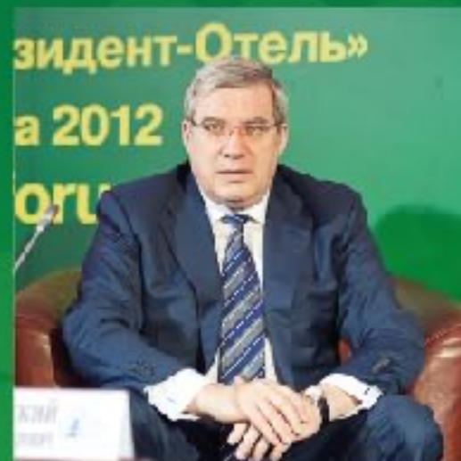
В.А. Толоконский полномочный представитель Президента РФ в СФО