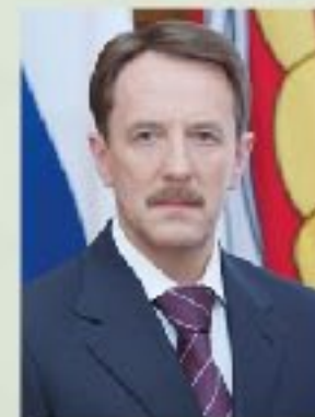
А.В. Гордеев губернатор Воронежской области