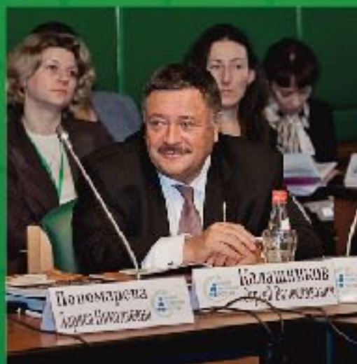
С.В. Калашников председатель Комитета Государственной Думы по охране здоровья