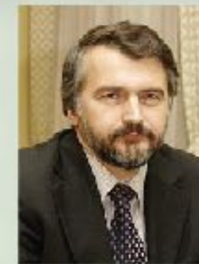
А.Н. Клепач заместитель министра экономи- ческого развития РФ