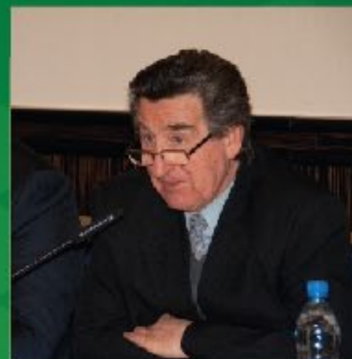
В.Б. Ефимов президент Союза Транспортников России, депутат Государственной Думы РФ