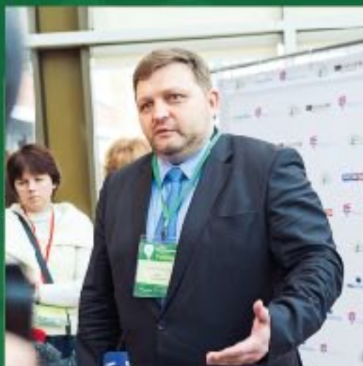
Н.Ю. Белых губернатор Кировской области

17 апреля 2013 года Москва, МГУ имени М.В. Ломоносова