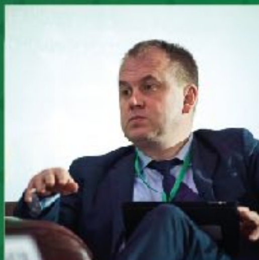
С.А. Наумов президент РАСО