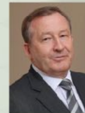
А.Б. Карлин губернатор Алтайского края