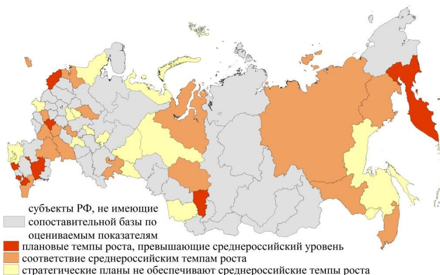
Рисунок 2 – Изменение значения ВРП субъектов РФ (2020 год к 2012 году), раз

определяет их достижение к заявленному периоду и, таким образом, гарантирует успешную реализацию стратегии.