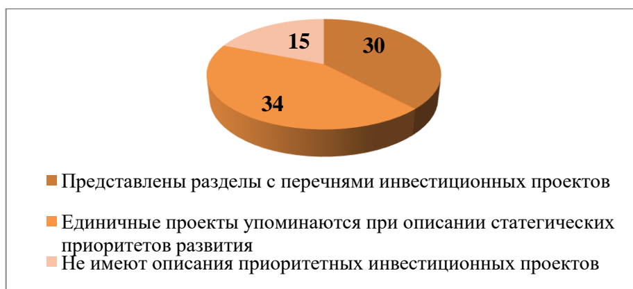
Рисунок 3 – Число субъектов РФ, имеющих описание инвестиционных проектов в структуре Стратегий, ед.

В целом, стоит отметить довольно широкий охват инвестиционными проектами различных сфер социально-экономического развития регионов.