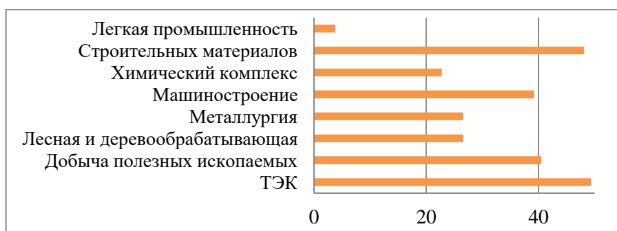
Рисунок 5 – Региональная дифференциация инвестиционных проектов по отдельным отраслям промышленности, %

Стоит отметить, что реализуемые в регионах инвестиционные проекты напрямую связаны со сложившейся экономической специализацией и имеющимся природно-ресурсным потенциалом.