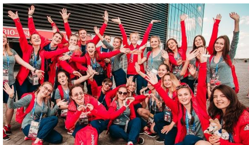
Развитие компетенций и социальная вовлеченность