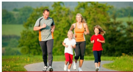
Распространение практики здорового образа жизни