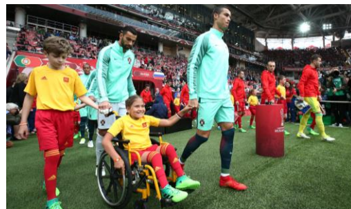
Открытое и толерантное общество