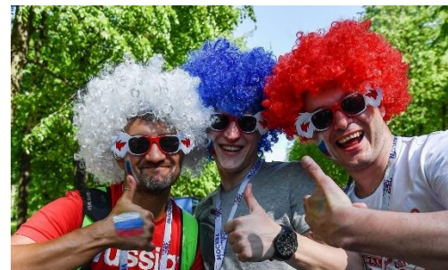
Повышение туристической привлекательности