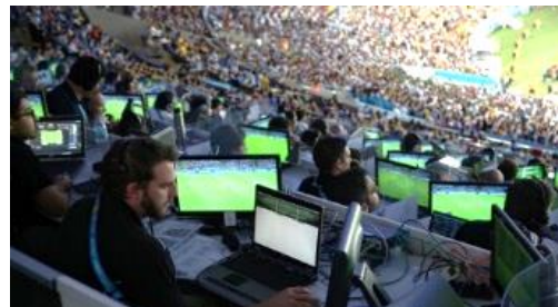
Внедрение новых стандартов и технологии